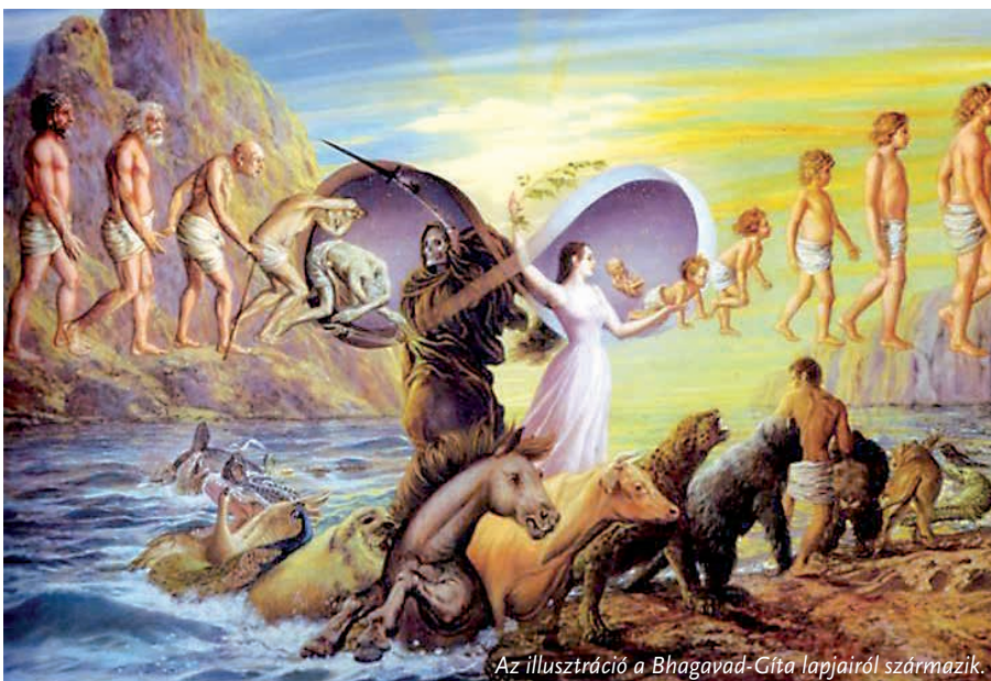
Az illusztráció a Bhagavad-Gíta lapjairól származik.