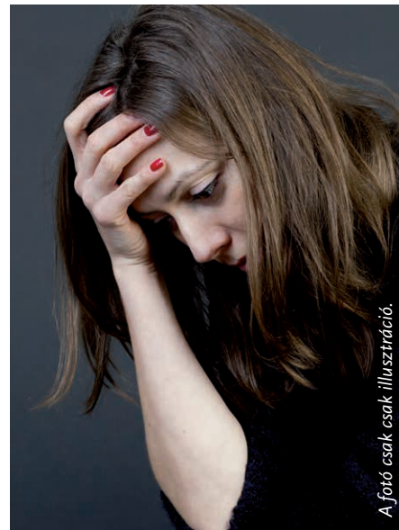
A fotó csak csak illusztráció.

Ezek után kíváncsi lettem a kozmetikumokra. Sorban kitétem őket az asztalra, és más „mérőműszerem” nem lévén, ingával végeztem el a tesztelést. Egyértelműen egy szájfény „jött ki” – amit szinte naponta használtam. Márkás nevű cég drága terméke, drága ajándék, kb. két