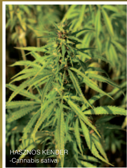
HASZNOS KENDER -Cannabis sativa

A nyugati orvostudomány hívei is elismerik, hogy a kender fogyasztása segít az álmatlanság, a depresszió és a migrén gyógyításában, megkönnyebbülést hoz az asztmás betegeknek, segít megszüntetni a menstruációs, a neuralgiás és a reumás eredetű fájdalmat, csillapítja a görcsöket, a hasfájást, valamint az onkológiai betegségek orvosi terápiájának ne-