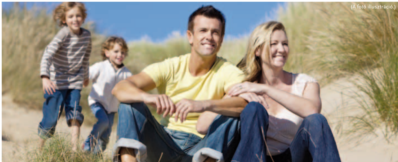
(A fotó illusztráció.)