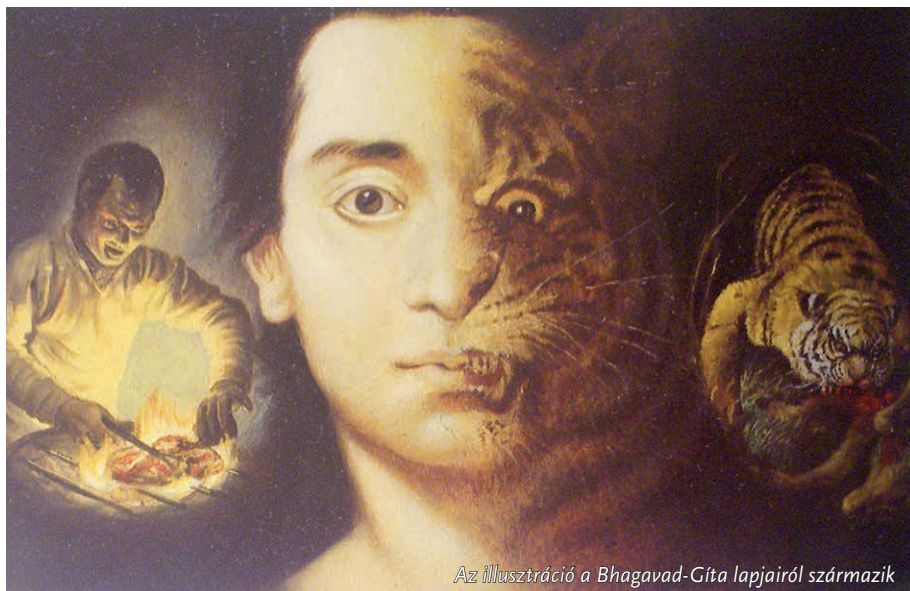
Az illusztráció a Bhagavad-Gíta lapjairól származik